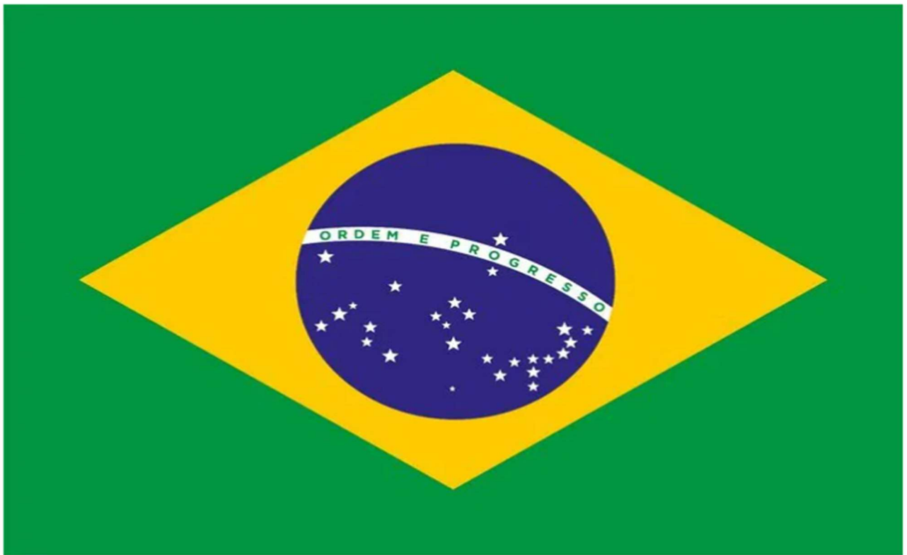
Bandeira nacional do Brasil